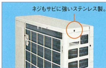
ネジもサビに強いステンレス製。